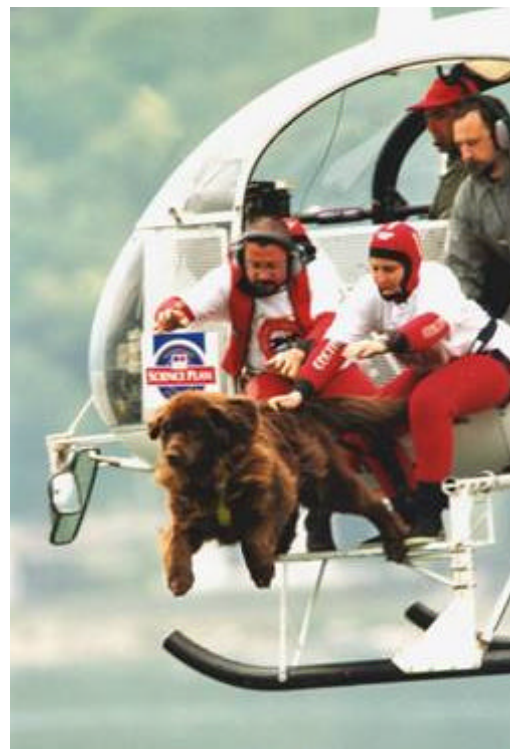
Il tuffo di Alyssha

Le tecniche elaborate dalla Scuola Italiana Cani Salvataggio Nautico sono il frutto dei consigli, esperienze e collaborazione venutisi a creare con i piloti ed equipaggi del Nucleo Elicotteristi Carabinieri e del S.A.R. Soccorso Aereo. Le macchine sulle quali le Unità Cinofile sono abilitate sono gli HH3F Pelican - AB 412 - Ecureil 2.