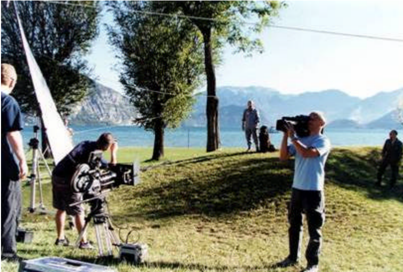
Il regista americano studia le luci prima di dare l' "Azione"

Si doveva girare l'imbarco, poi il volo ripreso sia dall'interno che dall'esterno con il cineoperatore appeso fuori con la cinepresa in spalla: come nei film.