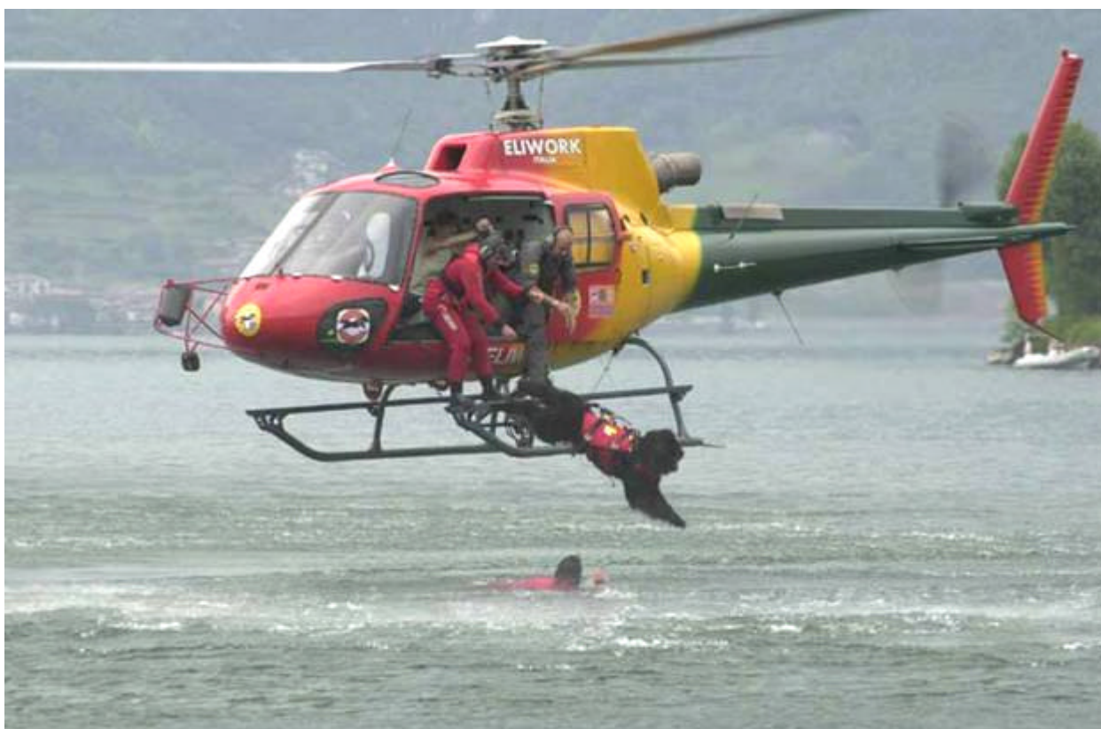
Max si lancia in soccorso dei un naufrago indossando un particolare imbrago galleggiante detto "Tartaruga"

Analizziamo ora punto per punto, esercizio per esercizio il Brevetto di Salvataggio Operativo, dando un particolare risalto al perché si sia giunti a tale tipo di stesura, evidenziando anche il tipo di esperienze operative che hanno dettato tali scelte.