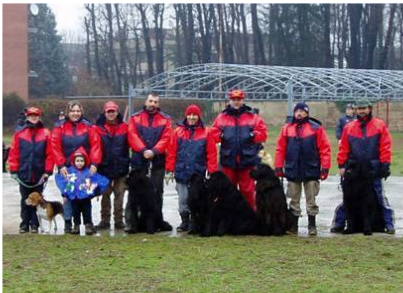
Gruppo di Istruttori SICS durante i corsi invernali

Alla SICS non si parla di psicologia canina ma si addestrano i padroni che a loro volta addestreranno i loro cani. La nostra FILOSOFIA è quella in cui coloro i quali hanno maggiore esperienza la trasmettono agli allievi, giorno dopo giorno, lavorando fianco a fianco. I MAESTRI insegnano agli apprendisti i trucchi del mestiere, mostrano aspetti che richiederebbero mesi se non anni di errori prima di essere notati. Insomma, diventare istruttore SICS è un lungo lavoro che dura mediamente oltre tre anni. Mi fanno veramente ridere coloro i quali credono che con i corsi per istruttore cinofilo che durano 9+5 giorni si possa diventare degli esperti. E' ridicolo, ma conosco personalmente gente che dopo tali corsi ha aperto campi di addestramento. Il buffo è che questi non