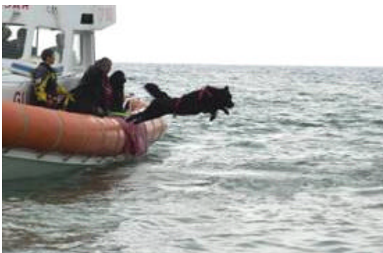
La decisione nel tuffo di Allegra

Abbiamo detto tecnico sportive per un ben preciso motivo. La tecnica che il conduttore adotta nell'andare verso il pericolante in acqua è demandata solamente ad una personale scelta. Non è infatti obbligatorio nessuno stile o metodo. Il conduttore può sia, ad esempio, precedere a stile libero il cane raggiungendo per primo il figurante, oppure farsi portare dal cane con la particolare presa definita "a delfino", dove il conduttore si attacca ai montanti posteriori dell'imbragatura marina da salvataggio del cane, risparmiando in tal modo preziose forze. Al cane, dopo che l'uomo ha afferrato saldamente il pericolante con una delle classiche prese di soccorso, è demandata la parte più impegnativa, quella cioè di "rimorchiare" i due a riva, vincendo, grazie alla particolare acquaticità e resistenza in acqua tipiche della razza Terranova, anche correnti che avrebbero sicuramente messo in difficoltà il conduttore che, libero dall'impegno di nuotare verso riva, può tranquillamente dedicarsi sia a tranquillizzare il pericolante, sia a praticare, se necessari, i primi soccorsi, non da ultimo la respirazione artificiale già in acqua.