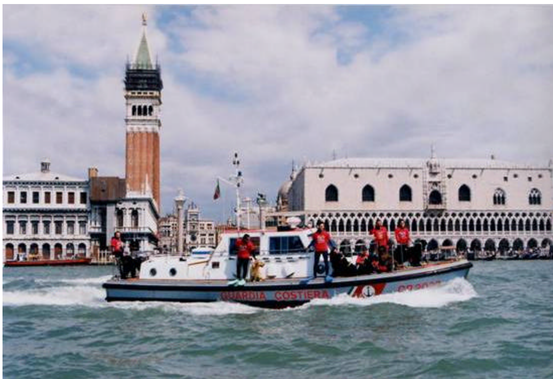
La squadra Sics pronta ad intervenire durante un'esercitazione congiunta con la Capitaneria di Porto di Venezia

Ricordiamo che già diversi paesi (Giappone, Germania, Brasile, Spagna, Svizzera) si sono interessati ai cani di salvataggio italiani, e tale successo deve essere chiaramente attribuito ai consigli che gli istruttori della Scuola hanno ricevuto dagli Uomini e Ufficiali della Guardia Costiera in questi anni.