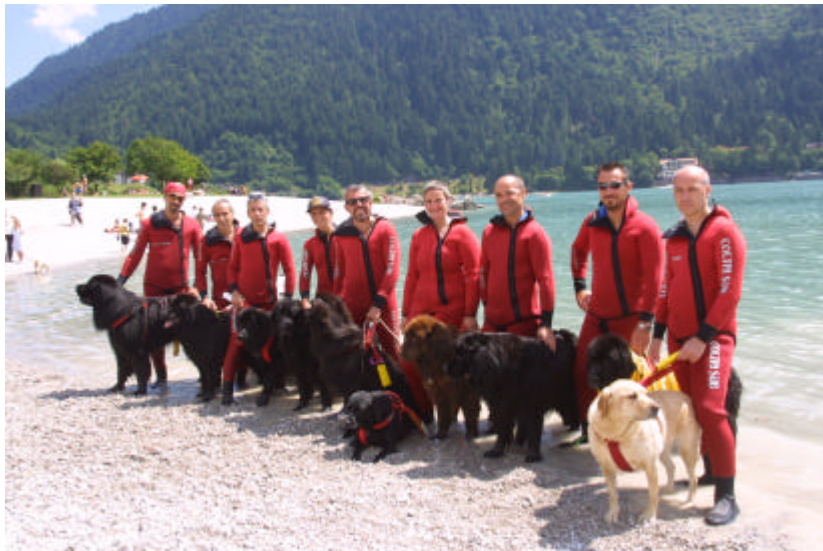
Istruttori SICS durante l'annuale esercitazione a Molveno

Mi sovviene quella frase di un famoso addestratore che commentando i successi sportivi di un cane, aveva aggiunto che il padrone valeva poco in confronto al cane che aveva la fortuna di possedere. Era il cane che valeva veramente. Un grande cane, con delle grandi doti. Il problema si sarebbe avuto col nuovo cane, magari meno dotato del primo. Se non si ha un metodo che estrae anche dai cani meno validi dei cani eccezionali, negli anni, si concluderà poco o nulla. Inoltre se si vorrà fare della competizione, in Protezione Civile e nel salvataggio, si sarà molto limitati. Non conta il cane migliore, conta la Squadra, conta saper addestrare tanti cani che siano sulle spiagge per salvare chi sta annegando. Quelle sono e saranno le vere medaglie, non quelle di latta delle gare. Non conta assolutamente chi arriva primo, ma chi partecipa e passa il brevetto. Negli anni Mas ai brevetti in Italia ma soprattutto all'estero, è arrivata prima molte volte, ma non me ne vanto, non l'ho mai fatto e non lo farò mai. Quello che veramente conta che i brevetti siano stati presi, e soprattutto che l'esperienza accumulata sia poi stata trasmessa di cane in cane, dal vecchio Mas al nuovo Mas.