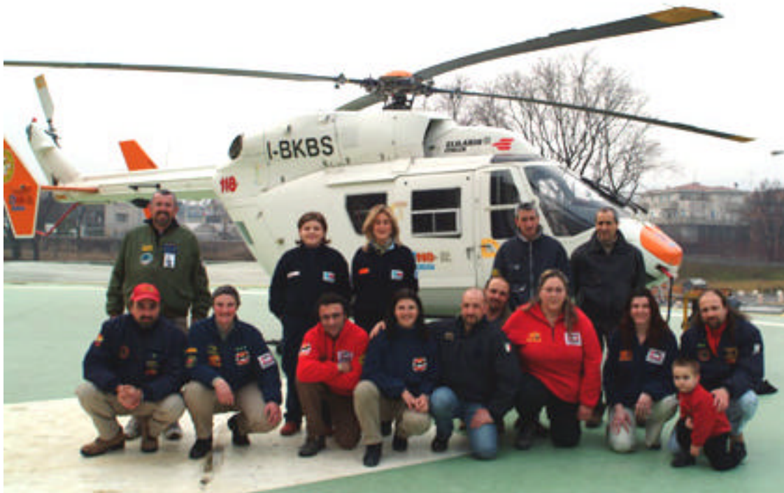
Il primo gruppo di istruttori SICS brevettati BLSD dal 118 di Brescia

Inoltre assumendo la posizione di rianimazione descritta (con il gomito sinistro in alto), l'effetto dinamico sull'acqua consente al soccorritore una maggiore galleggiabilità che permette di sollevare agevolmente il viso dell'annegato.