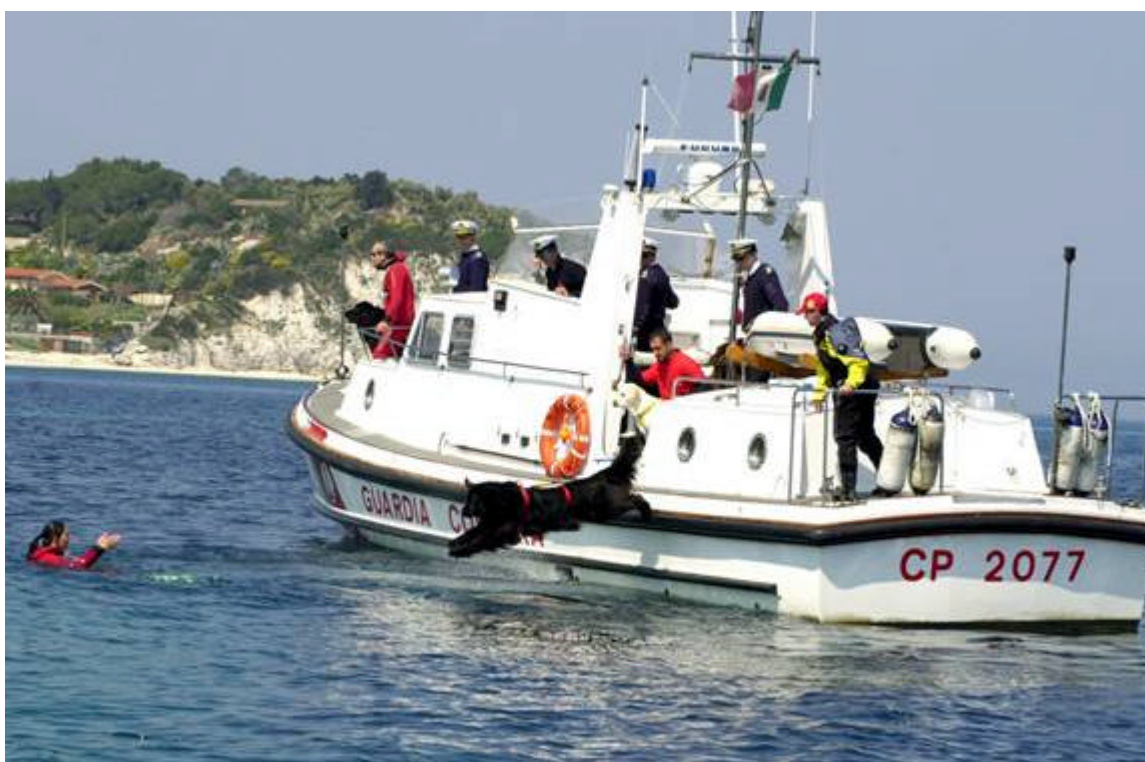
Dakota segue Elsa in un intervento congiunto con la Capitaneria di Porto

Si può volendo issare un cane "a pelo" ma ritengo che sia doloroso per il cane, quindi da evitare.