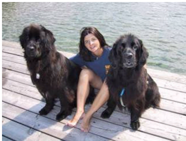
Elsa con Mas e Dakota

È quindi questo il primo consiglio che mi sento di darvi, fate in modo che il vostro cane diventi la vostra ombra, vi segua ovunque voi andiate, viva con voi in casa, venga in vacanza con voi, sulla spiaggia e in mare, e soprattutto a nuotare con voi fianco a fianco, questi sono i punti fondamentali per poter aver successo con il vostro cane.