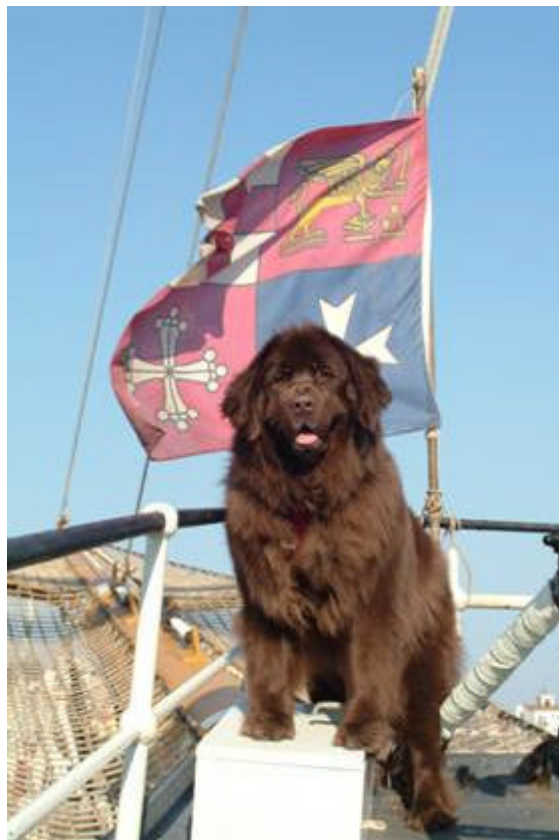
Alyssha sul Veliero Palinuro

Altre avventure ed esperienze ci aspettano.