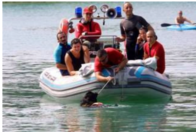
Lady impegnata nel traino del gommone