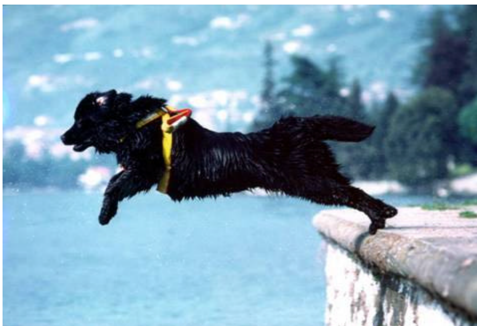
Foto di Daniele Robotti in cui è ritratto Mas in un bellissimo tuffo da questa foto è nato il distintivo della scuola

In quel momento non sapevo che oltre al filmato i canadesi avevano venduto i diritti per un libro a una casa editrice americana di New York, che del documentario ha realizzato un bellissimo libro. La storia di Mas è la prima ed è emozionante sfogliare il libro con le sue foto. Non sapevo allora che dal documentario e da quel libro sarebbe nato addirittura lo spot pubblicitario Eukanuba Usa col nuovo Mas come attore, girato in Italia in pellicola 35 millimetri come un film.