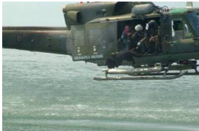
Il tuffo di Asso dall'AB412 della squadriglia Sar di Milano dell'Areonautica Militare

Dovrà saper operare nonostante il flusso rotore che nebulizzerà l'acqua ricreando condizioni simili alla burrasca per prestare soccorso ai naufraghi. Al termine dell'operazione di soccorso, collaborando con l'equipaggio dell'elicottero, dovrà saper effettuare l'operazione di verricellaggio, conoscendo sia le tecniche che le attrezzature.